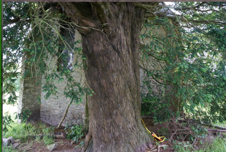
Santé de l'arbre