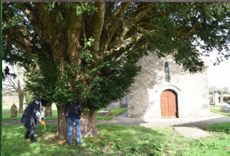
Santé de l'arbre