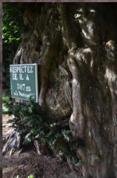
Santé de l'arbre