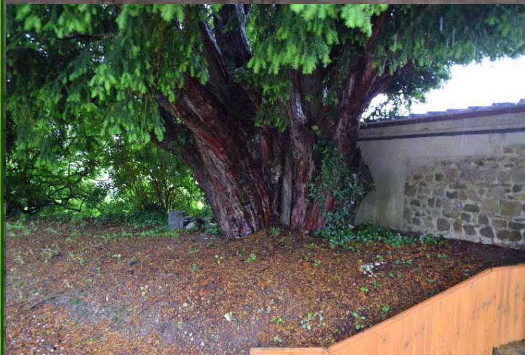
Santé de l'arbre