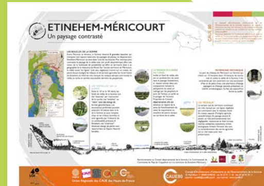
Etinehem - Méricourt (80)