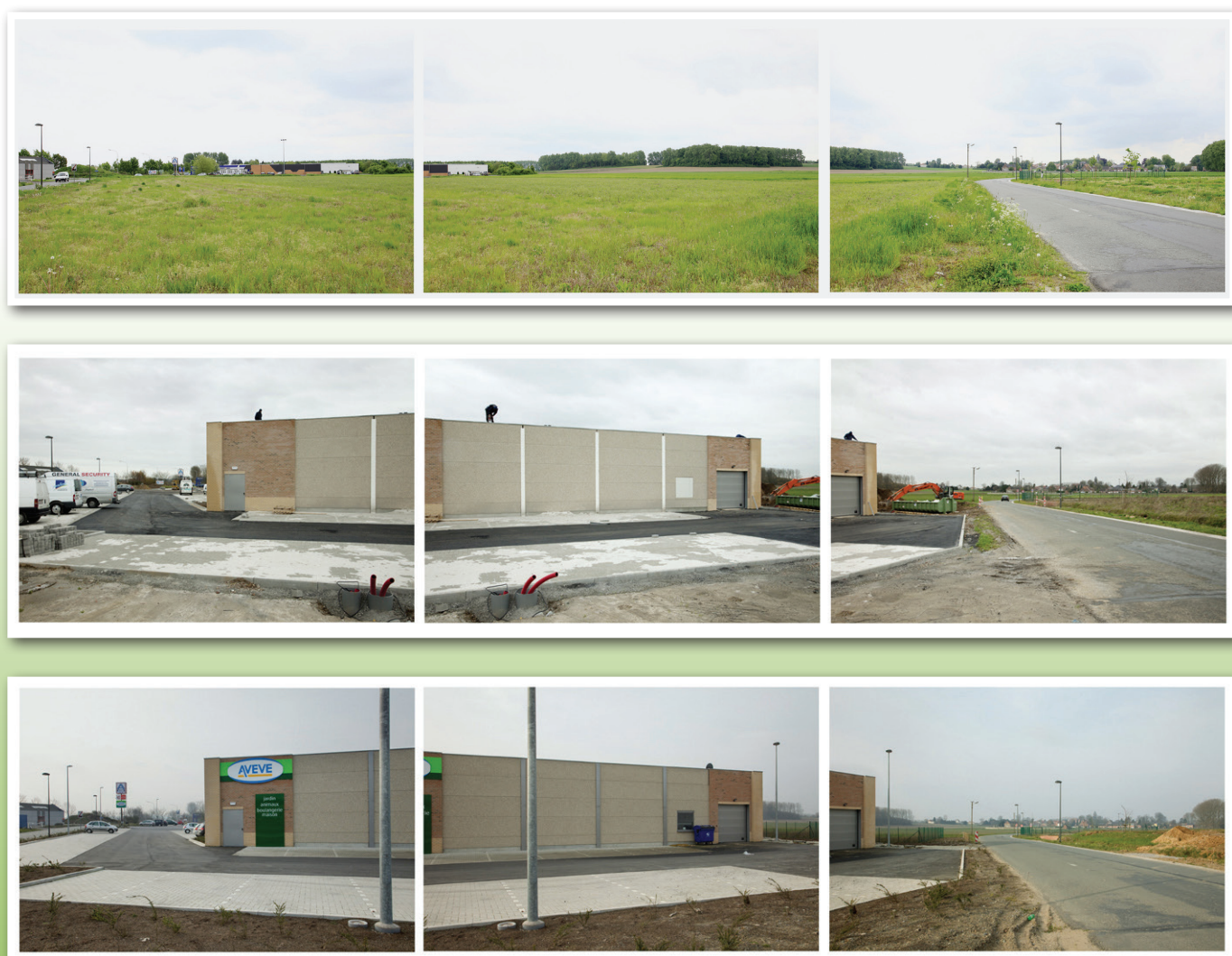
Évolution du zoning, chemin de Thumaide, à Roucourt (printemps 2009, hiver 2009-2010 et printemps 2011)

En dehors de projets définis, les mini-observatoires peuvent plus simplement être mis en place pour suivre l'évolution au quotidien des paysages d'une commune ou d'une intercommunalité.