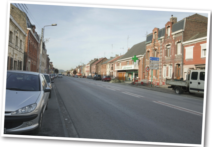
Site de la future ligne 2 du tramway Valenciennes-Pays de Condé, avant travaux (2009). Bruay-sur-l'Escaut, rue Jean-Jaurès

En particulier, le suivi par la photographie peut aider à évaluer et ajuster les mesures d'intégration paysagère et architecturale, ou les mesures compensatoires qui avaient été décidées dans les études préalables des projets.