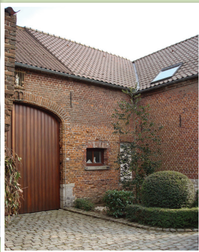
Opération de requalification d'abords de fermes, sur le Parc naturel des Plaines de l'Escaut : retour sur site quelques années après les plantations