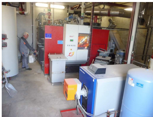
La chaudière Compte R (puissance 250 KW) et une chaudière fioul d'appoint (750L/an)