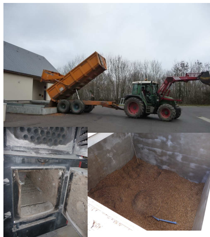
L'hiver, 1 livraison tous les 10 jours