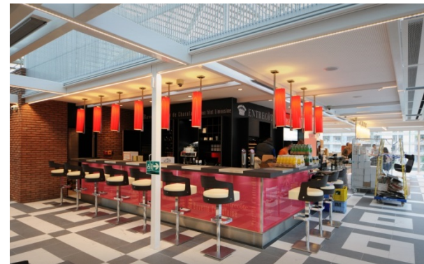
CAFE PREMIER PARIS GARE DE LYON