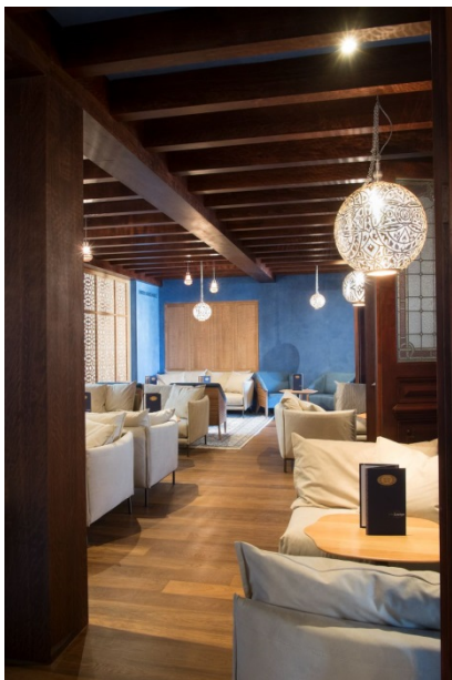
LE TRAIN BLEU PARIS GARE DE LYON : UN LIEU PARISIEN MYTHIQUE ENTIEREMENT RENOVE