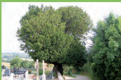
[m] If commun

Taxus baccata L. | Teurthéville-Bocage | Cimetière | h: 18 côté route et 16,50 dans le clos de l'église | ht: 1,1 dans le clos de l'église | d: 180 | e: 13 | L'if est taillé en table à 2 m de haut environ. Il s'encastre dans le mur du cimetière. L'écorce et le mur, recouverts de lichen, se distinguent à peine l'un de l'autre. La vue sur l'arbre encastré dans le mur d'enceinte est particulièrement insolite depuis la route. | •••