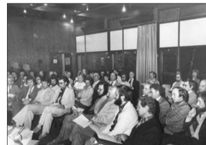
Maison des jeunes et de la culture Aux jeunes susceptibles de s'ennuyer dans les ZUP, la France offre ces espaces de rassemblement, d'échanges et d'activités. Bourg inscrit la sienne dans un ambitieux projet de création d'un quartier réunissant hall d'exposition, salle de sports, conservatoire de musique. En but à la réalité du foncier et des financements, la MJC simplifiée s'érige en solitaire. Elle constituera néanmoins un pôle de la vie burgienne.