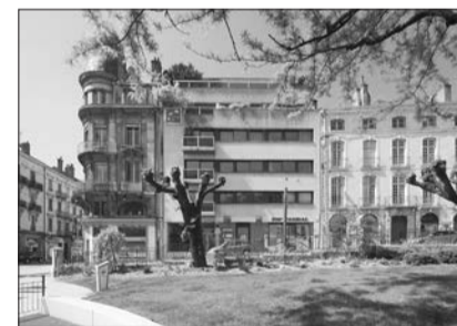
immeubles Question centrale du XXe siècle, le logement subit de profondes mutations en quelques décennies. Intégrant les premiers éléments du confort, s'inscrivant dans des opérations de constructions de grande ampleur, se glissant dans la ville existante, il prend des formes multiples et marque la vie de chaque citoyen. Progressivement, les immeubles signés par Pierre Dosse comme ceux de Marc Dosse se sont inscrits dans le paysage de la vie quotidienne des burgiens au point de s'y fondre.