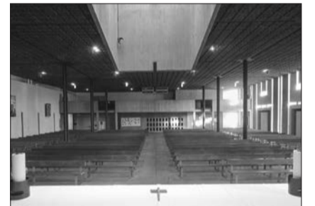
Bourg-en-Bresse, église Saint-Pierre-Chanel. Ce ne fut pas vraiment simple de trouver le terrain pour bâtir ce volume précédé du quinconce de ses cloches. Les autorités voulaient le cœur du Grand Ensemble de la Reyssouze. Ce fut finalement le site triangulaire, quasi frontalier, face au cimetière. De triangulaire, le projet se transforma en cette forme qui est plus chahutée qu'elle n'y paraît au premier regard. La nef à la lumière ciselée confirme une fausse simplicité mais aussi l'authentique dépouillement.