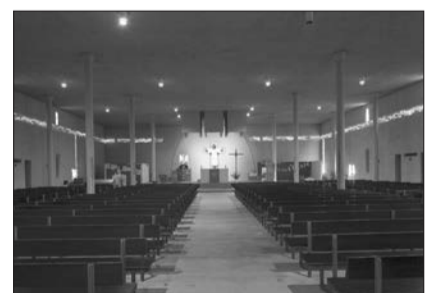
Oyonnax, Notre-Dame de la Plaine. Le lien avec le quartier sonne jusque dans le nom choisi pour le nouveau lieu de culte. Les bâtiments de la ZUP sont hauts, longs, puissants. L'église, leur église est sans concession : comme taillée dans un bloc de béton plus considérable encore. Il faut cela pour contenir la foule attendue des fidèles. Mais passée le long plan incliné qui conduit au niveau de la nef, l'amabilité est là, palpable, le liseré coloré court autour de l'assemblée, la lumière et la clarté sont adroitement distillées...