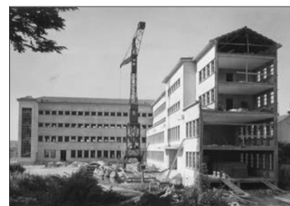
Carriat Initiée dans les années 1930, la mutation de cet établissement d'enseignement débute réellement en 1944 et se concrétise par un concours pour sa conception, jugé en 1945. S'engage ainsi un processus pédagogique, administratif, financier et architectural qui s'achèvera vingt-cinq ans plus tard lors de l'inauguration de la piscine signalée par la grande fresque de Gustave Singier.