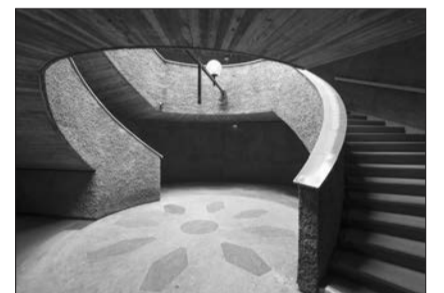
Ars-sur-Formans, basilique souterraine. Pour ne pas édifier un volume saillant de plus entre la basilique, la maison du saint curé et les bâtiments conventuels, s'enterrer constitue une solution que Lourdes et Ars mettent en œuvre. Cela suppose ici d'offrir aux processions et aux fidèles plusieurs accès et une nef aux dimensions de leurs assemblées : plus de trois mille personnes peuvent y prendre place.