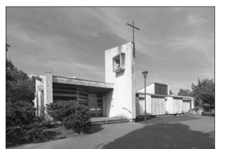
Pontcharra-sur-Bréda et Villefranche-sur-Saône. L'église Saint-Hugues et le centre paroissial du Saint Curé d'Ars illustrent la présence de Pierre Pinsard en Auvergne-Rhône-Alpes. Celle-ci se manifeste également par des logements sociaux (Saint-Fons, Pontcharra et Le Chambon Feugerolles) et par des équipements hospitaliers (Annemasse).