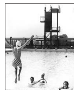
Centre nautique Emblématique de la société des loisirs, il se substitue à la Drague à la suite d'un long processus de gestation. Aux ingénieurs des Ponts et chaussées initialement sollicités sont adjoints Marc Dosse puis Pierre Dosse. Ceux-ci déterminent le principe d'un long bâtiment qui file dans le site et d'un cheminement haletant de montée vers le grand bain et les plages. Ils couronnent l'ensemble du plongeoir, une véritable sculpture de dix mètres de haut !