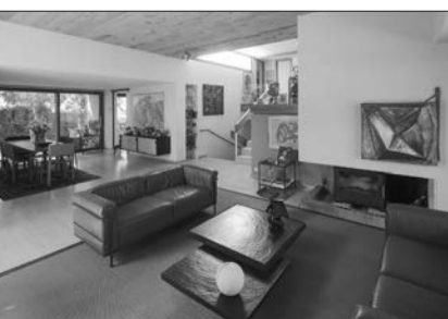
Maison Dosse Construite pour lui-même et sa famille, cette maison est l'un des trésors architecturaux de Bourg-en-Bresse. Discrètement établie sur une parcelle verdoyante, elle s'ouvre pleinement sur son environnement végétal. Dépourvue de cloisons, truffée de perspectives changeantes, enrichie de demi-niveaux, elle est intemporelle, chaleureuse et accueillante. C'est également un témoin de l'intérêt de l'architecte pour les créations des artistes de son temps.