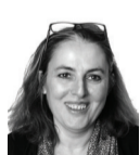
Anne SELVA 139 communes,

5 ctés de communes (CC Haut Bugey, CC Pays de Gex, CC du Pays Bellegardien, CC Bugey Sud, CC du Plateau d'Hauteville)