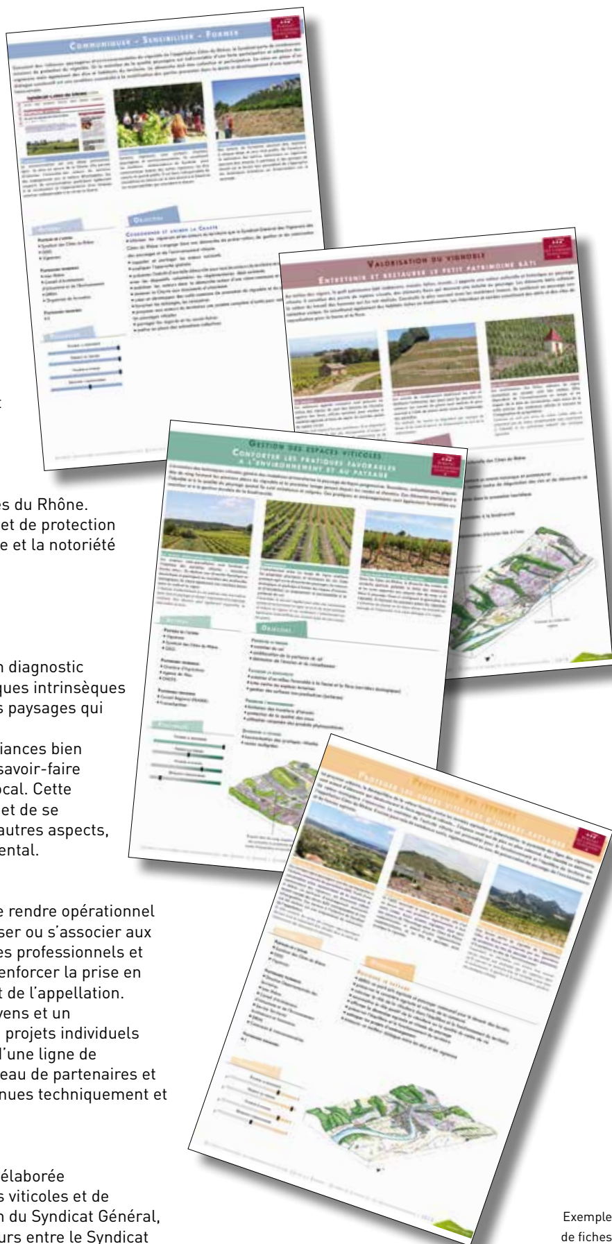
Exemple de fiches d'actions et de recommandations

Pour mener à bien ce projet d'envergure, une charte a été élaborée pour contribuer à la gestion et la valorisation des paysages viticoles et de l'environnement. Une chargée de mission, recrutée au sein du Syndicat Général, accompagne les vignerons. Les partenariats actuels et futurs entre le Syndicat Général et les organismes du territoire permettent de déployer la stratégie paysagère et environnementale des appellations des Côtes du Rhône.