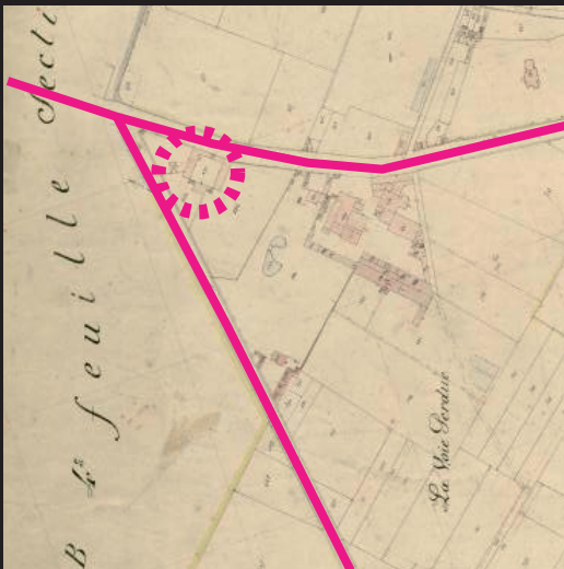
Auparavant à la limite entre village et paysage