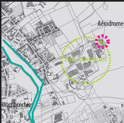
Mais désormais intégrée dans une zone commerciale

La ferme «Les jardins de la ferme», située à Wambrechies constitue un autre exemple remarquable du territoire.