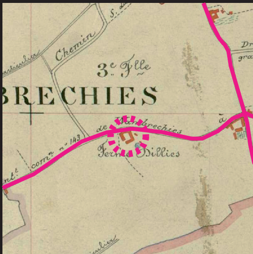
Auparavant à proximité du centre mais au coeur de ses terres