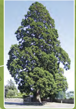
l'arbre des écologues Séquoia géant | Sequoiadendron giganteum (Lindl.) Buchholz | Saint-Lô | rue du Général Dagobert G.P.S.: 49,114101 -1,0866