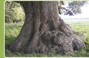
l'arbre "frottou" Chêne pédonculé | Quercus robur L. Saint-André-de-Bohon | Conservatoire des antiquités et objets d'art, lieu-dit La Maison de l'Ange G.P.S.: 49,2365 -1,2439