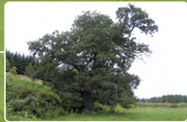
l'arbre tortueux Chêne pédonculé | Quercus robur L. | Saint-Ébremond-de-Bonfossé le Béron, en bordure de route G.P.S.: 49,0807 -1,11956