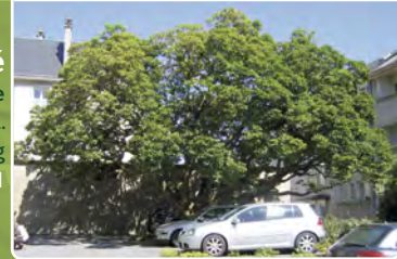
l'arbre ensoleillé Magnolia de Soulange | Magnolia X soulangeana Soul. Bocl. | Saint-Lô | 36 rue du Neufbourg G.P.S.: 49,115398 -1,08781