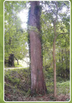
l'arbre du vallon Aulne commun (glutineux) Alnus glutinosa Gaertn. | Agneaux | parc de la Palière G.P.S.: 49,1208 -1,11227