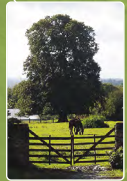
le bel arbre de plein champ Tilleul à petites feuilles | Tilia cordata Mill. | Cavigny | Lieu-dit La Perrelle G.P.S.: 49,1852 -1,12473