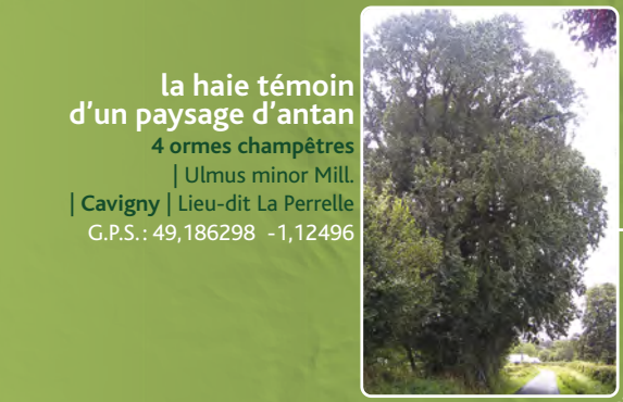
la haie témoin d'un paysage d'antan 4 ormes champêtres | Ulmus minor Mill. | Cavigny | Lieu-dit La Perrelle G.P.S.: 49,186298 -1,12496

D'autres, comme le Séquoia et le Magnolia viennent de loin, rapportés par des voyageurs en quête de découvertes. Ils étendent la palette végétale des arbres traditionnellement utilisés et viennent embellir les cours intérieures ou d'école.