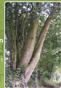
un houx pas commun Houx commun | Ilex aquifolium L. | Quibou | C.R. n°2 du carrefour Huet G.P.S.: 49,061699 -1,21581