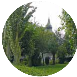
Départ de la mairie d'Oxelaëre.