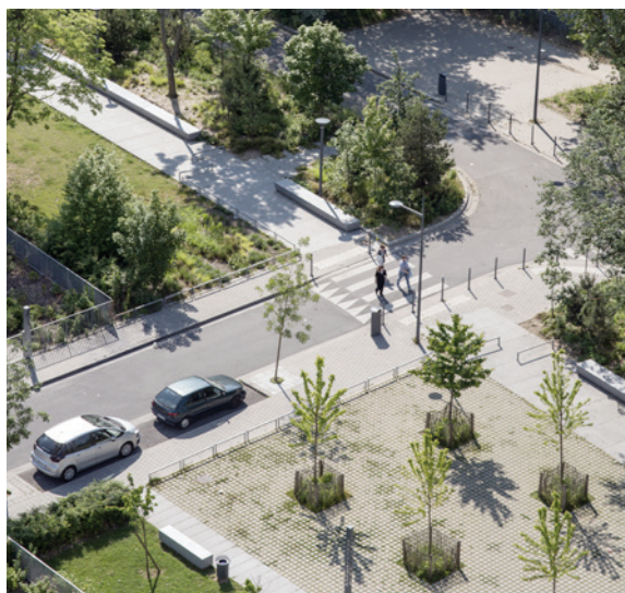
vues sur les jardins et espaces publics

En épine dorsale a été mise en oeuvre, une grande promenade piétonne de 600m de long, accompagnée d'un grand banc de 400m. et de généreux massifs boisés. Elle est jalonnée d'équipements sportifs et d'espaces de jeux. Elle croise le « jardin des cultures », un vaste jardin cultivé et partagé par les habitants. L'aménagement soigné des voies, espaces publics et jardins cherche à apporter une cohérence urbaine à l'ensemble du quartier.