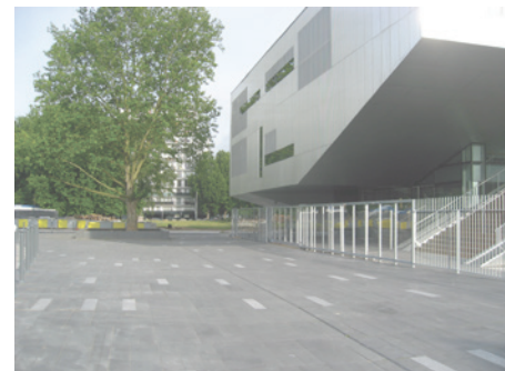
^ Placette de l'Arbisseau et nouveau centre social

Les objectifs du prolongement de la rue de l'Asie sont d'améliorer la desserte du sud du quartier de Lille Sud, de créer une « façade sur le « parc des équipements » qui se prolonge vers le nord dans le quartier Arras-Europe et de desservir trois nouveaux programmes de logements, des équipements importants pour le quartier mais également « le jardin de craie » qui initie de début de l'aménagement du Mail Gide-Vallés à l'est de l'opération. L'opération Carré Orchestra se situe à la jonction de ces deux grands projets de rénovation urbaine et s'inscrit naturellement dans leur continuité par la création d'un square public (Jardin de la Fauvette Grisette) qui relie les parties nord et sud de ce parc.