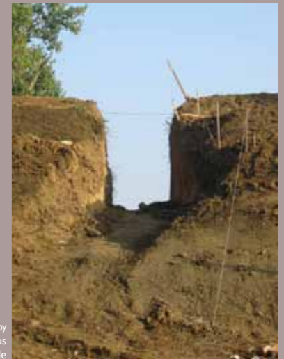
Restauration de la contre garde du Roy Le talus

Les terres formant le corps profilé de la contre garde seront pour l'essentiel restituées selon leur état du XIX e siècle. Le bonnet situé au centre de la contre garde et les deux retranchements seront ainsi à nouveau profilés.