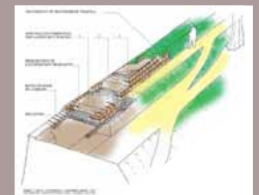
Techniques de reprofilage du parapet Mise en œuvre des moellons de terre crue

Des moellons de terre crue pressée seront préparés selon le procédé utilisé par Simon Vollant sur certains parapets de briques de la citadelle. Le principe de reprise de ce talus garantira la conservation du capital écologique en présence en conservant une grande partie des masses de terre du parapet.