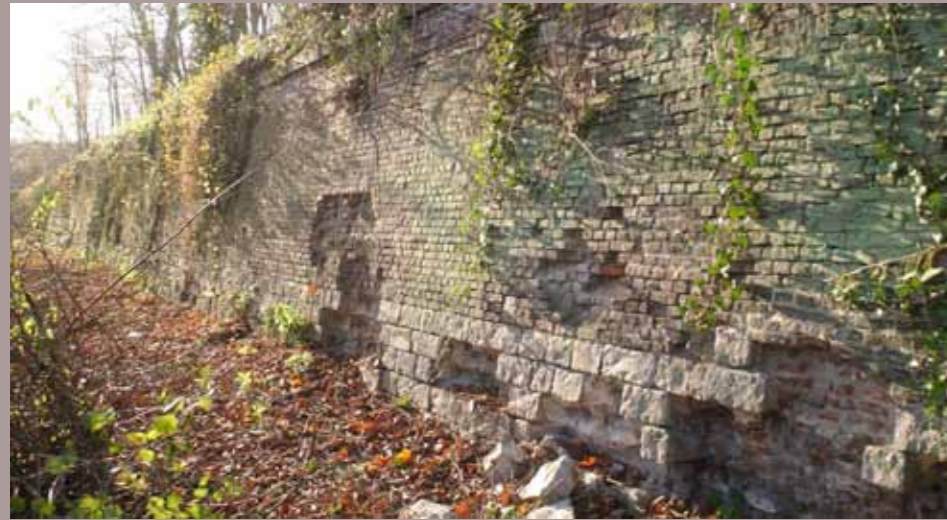
La face droite de la contre garde du Roy avant la restauration