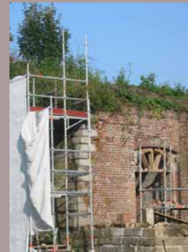
Restauration de la contre garde du Roy Entrée d'une galerie

L'exécution se fera à l'outil manuel sous réserve de ne pas ébranler la stabilité des maçonneries attenantes et les parties délicates de l'ouvrage.