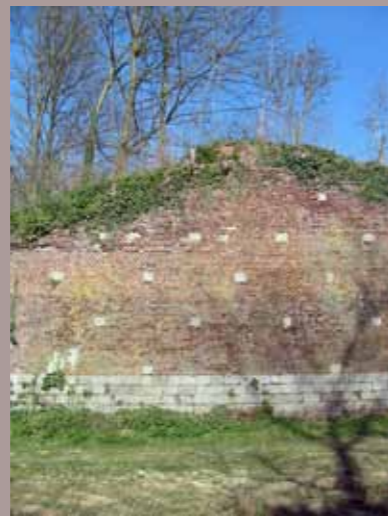
La face droite de la contre garde du Roy détail. Les boutisses en grès

L'état d'origine est cependant toujours visible dans la forme générale de la contre garde et de ses retranchements, mais aussi dans la plupart des parements maçonnés. Ces derniers sont constitués de chemises de briques agrafées par les boutisses de grès et couronnées par des cordons en grès. Les soubassements sont également constitués de blocs de grès.