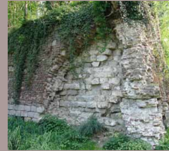
Restauration de la contre garde du Roy - L'arraché pédagogique