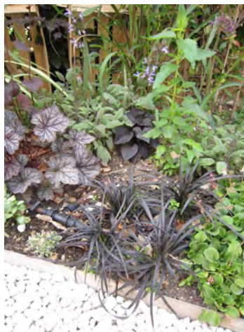
Ophiopogon , Vinca minor (pervenche), Heuchera (heuchère)...