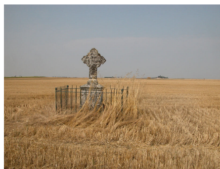
Monument à Villepuan (guerre de 1870)