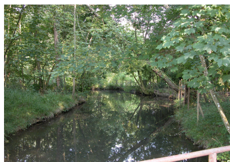
Au détour des Mauves : le toit végétal, le ciel en bas, le regard dans les branches et les reflets de l'eau