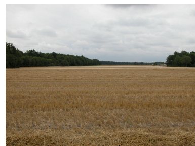
Les silhouettes des arbres et des villages ( Baccon et les lisières des Mauves)