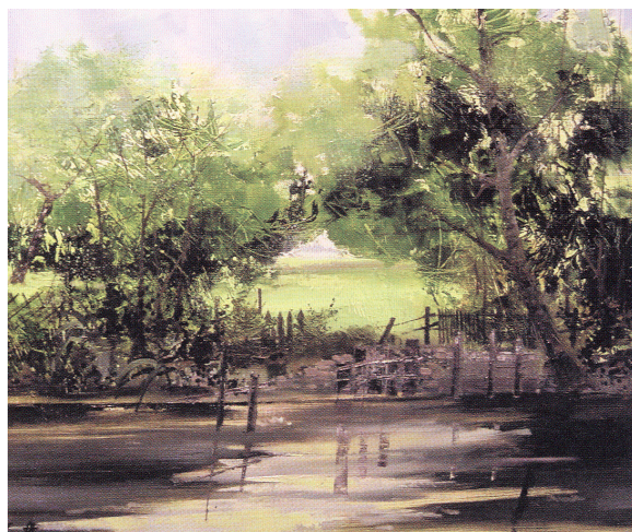
L'ombre, la fraîcheur et des dégradés de verts des Mauves par Marc Lecoutre

Les Mauves, en se contorsionnant dans ce plateau, appellent et attirent par leur contraste. Marc Lecoutre restitue à sa manière l'ombre, la fraîcheur, les dégradés de vert, la vie calme de l'eau qui s'écoule dans le petit val.