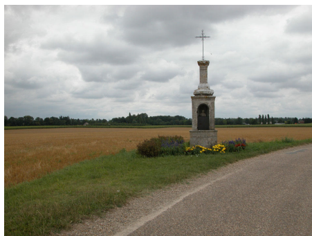
Calvaire à Huisseau-sur-Mauves

En réalité, ces paysages que l'on traverse souvent rapidement, qui piègent le regard dans des perspectives fuyantes portant à l'évasion, ne sont qu'illusions. Mégalithes, calvaires, monuments aux morts, rappellent que ces paysages sont bien réels et sont aussi chargés d'histoire et du vécu des différentes générations qui se sont succédées.