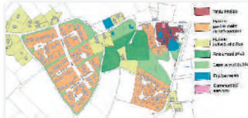
Plan général de la commune de Clayes : typologie bâti.