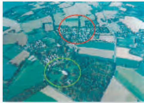
Visualisation du Château de Clayes Palys et son parc (cercle vert) et du lotissement de la Croix Simon (cercle rouge).