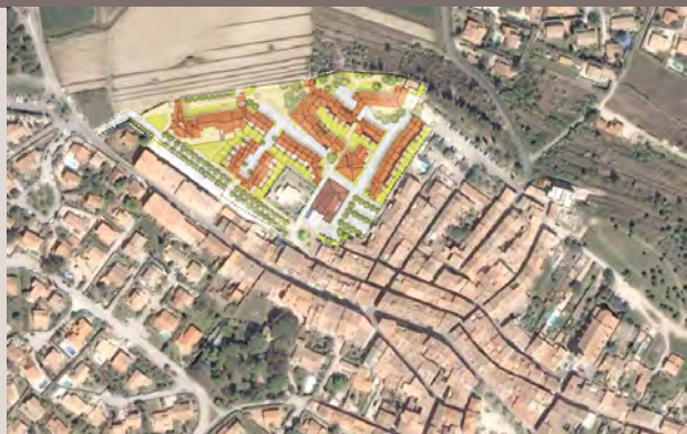
Un plan de composition urbaine bien inséré