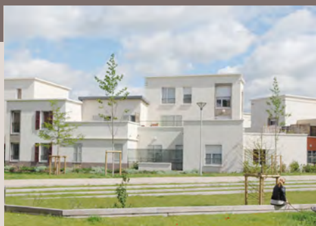
Vers une diversité des formes d'habitat dense individualisé ...