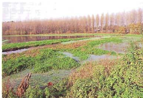
les ambiances de la cité : de la forêt au marais