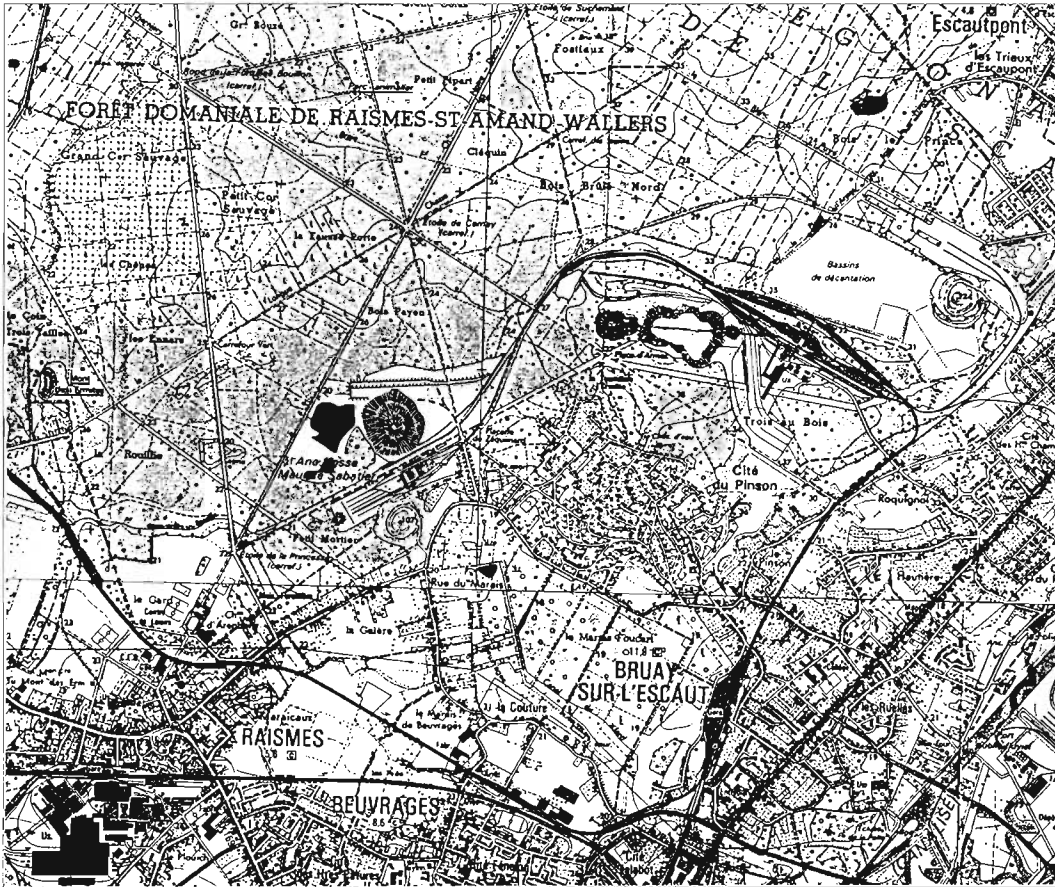
Carte de localisation, d'après IGN 1/25 000

panoramiques... Seul le site de Trois au Bois étend encore ses vastes "steppes", hier couvertes d'installations industrielles.