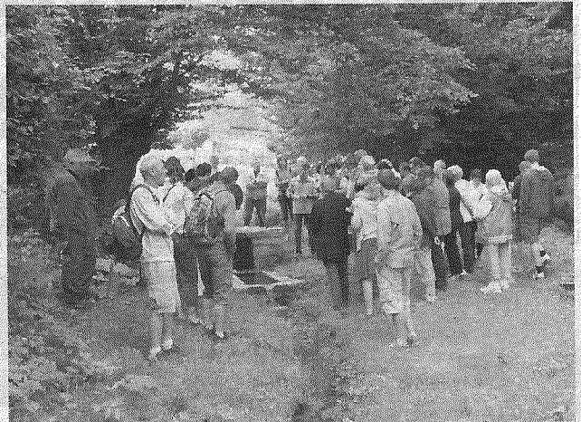
La fontaine se trouve sur le chemin des Chevaux.

L ez-Fontaine accueillait, dimanche, la Randonnée cyclo du Parc naturel régional de l'Avesnois A la découverte du petit patrimoine bâti et restauré. Avant le départ des trente cyclotouristes, chacun a pu s'intéresser à l'exposition sur le patri-