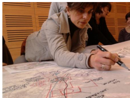
Photo 3 : Atelier « Territoire et Projet » à Valenciennes Métropole

Dans le cadre de la mission d'assistance du maître d'ouvrage, le CAUE du Nord a mis en place des ateliers de coproduction qui se sont déroulés à Valenciennes Métropole avec la participation de chefs de projet CUCS et ANRU. Les intervenants du CAUE du Nord menant pour la première fois ce type d'atelier, je leur ai proposé d'évaluer leur prestation auprès des participants par le biais d'un questionnaire.