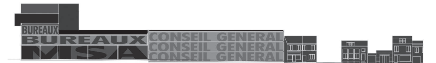
COUPE PROGRAMMATIQUE RUE GUSTAVE THIETARD