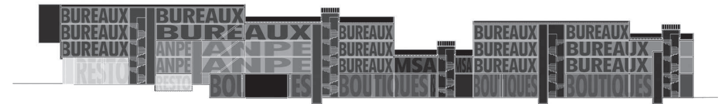
COUPE PROGRAMMATIQUE SUR LE PARVIS PIETON