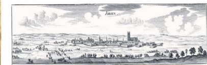
Archives départementales - 1000