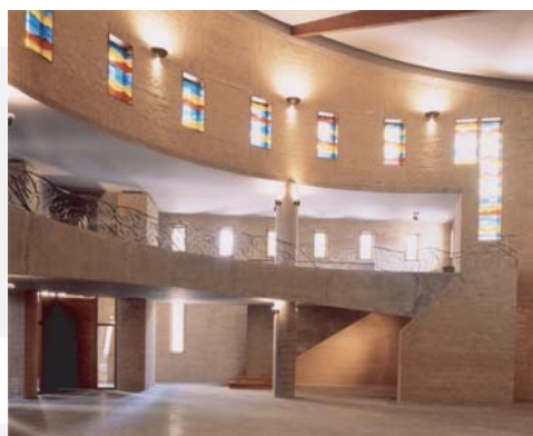
a u t e l