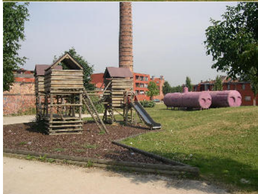
Coeur d'îlot vert destiné au loisir et à la détente; présence de l'ancienne cheminée.