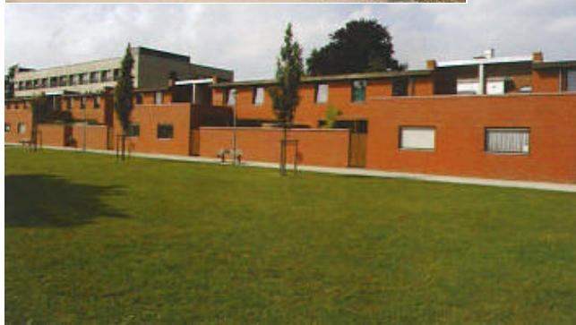
Arrière des maisons jumelles donnant sur le coeur d'îlot.