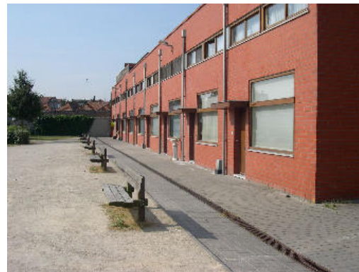
Maisons en bande