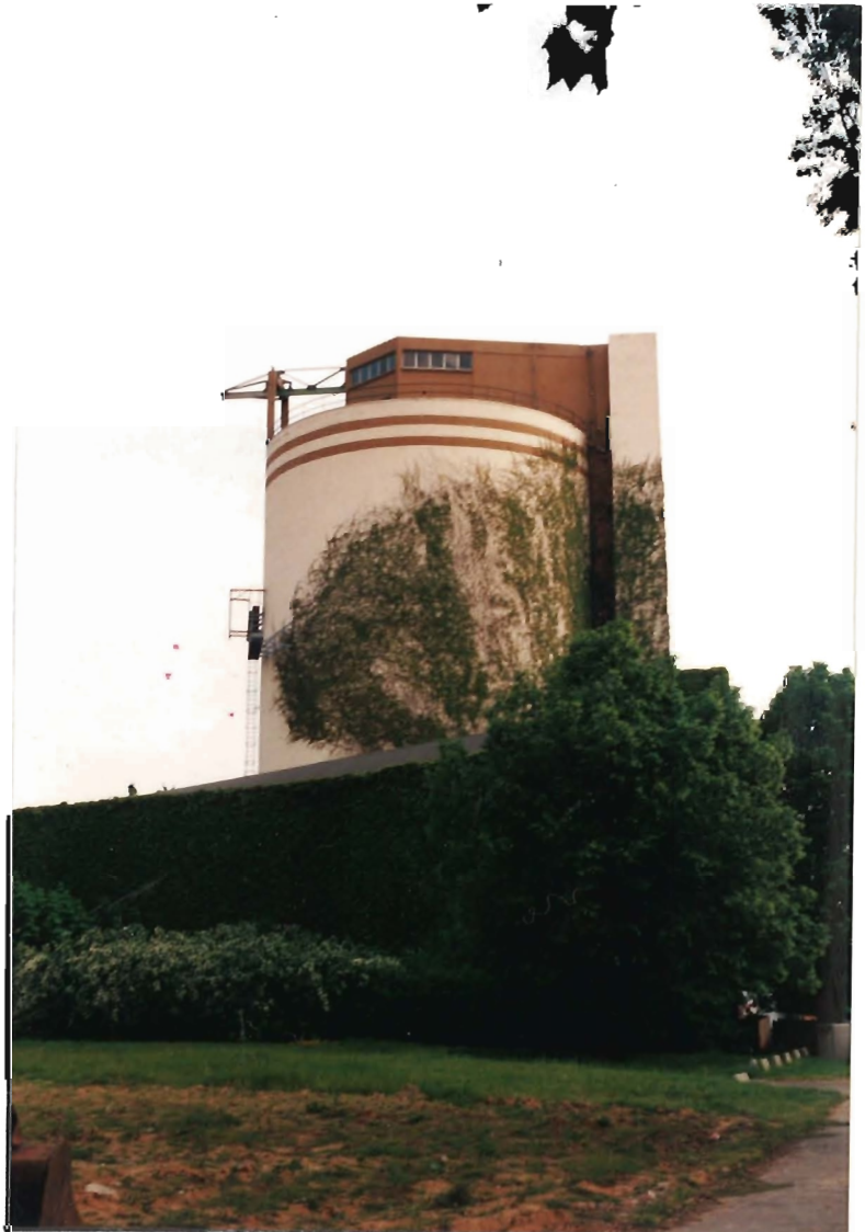
Vigne vierge sur volume industriel. Lille

Certains matériaux peuvent aussi permettre l'accroche d'une végétation grimpante et favoriser ainsi l'intégration du bâtiment en le faisant lui aussi évoluer avec les saisons.