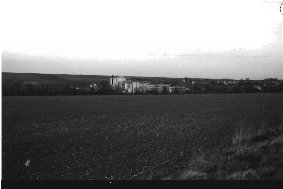
Vue depuis la départementale 96

Les vues de l'entreprise depuis le plateau sont les plus agressives puisque les bâtiments sont alors perceptibles dans tout leur développement et que leur couleur claire se détache sur les fonds verts et bruns du paysage.