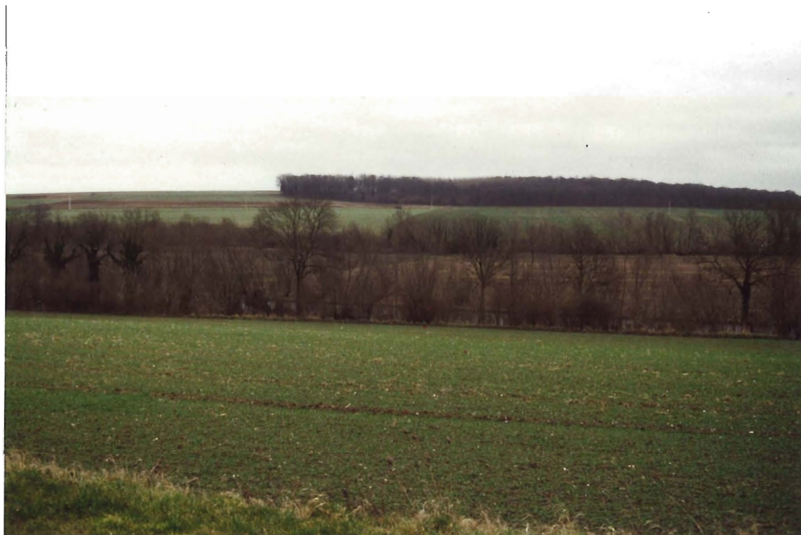
La vallée du Haut-Escaut

L'entreprise Royal Canin se situe entre l'openfield des plateaux de la commune des Rues-des-Vignes et la vallée humide du Haut-Escaut.