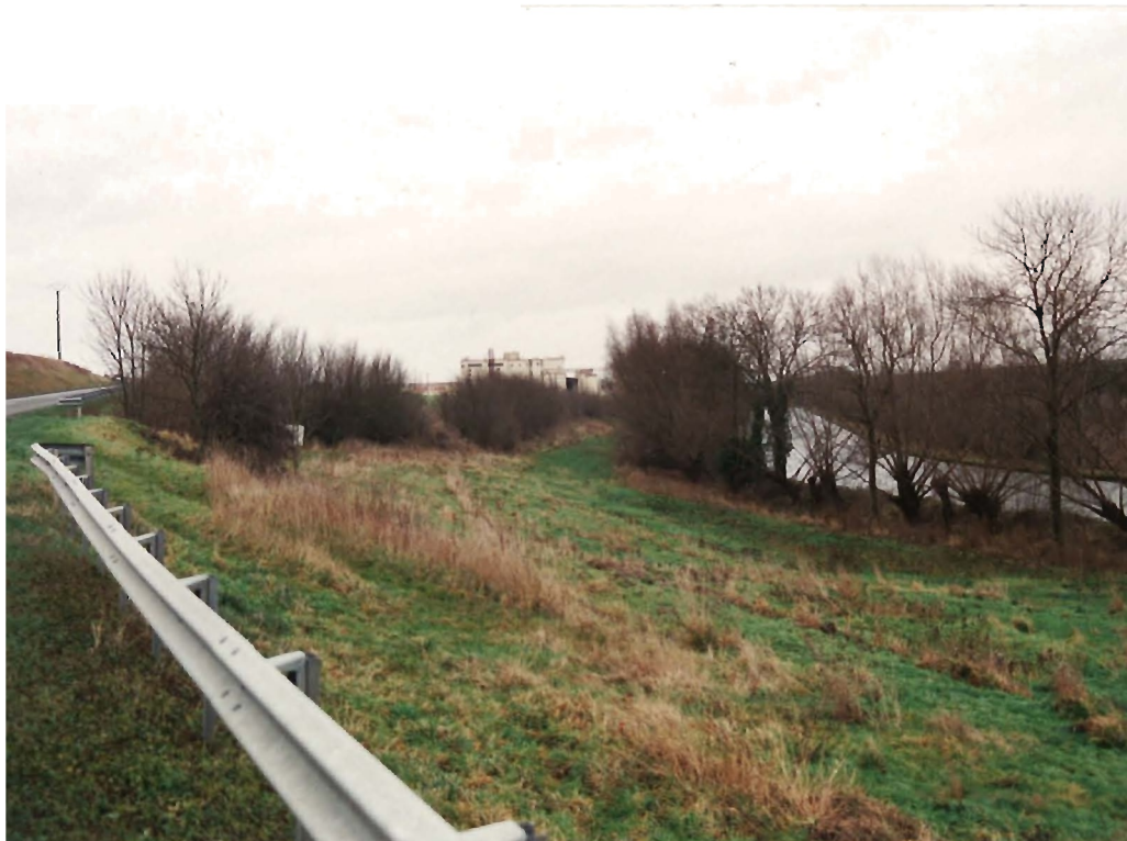
Vers l'entreprise Royal Canin