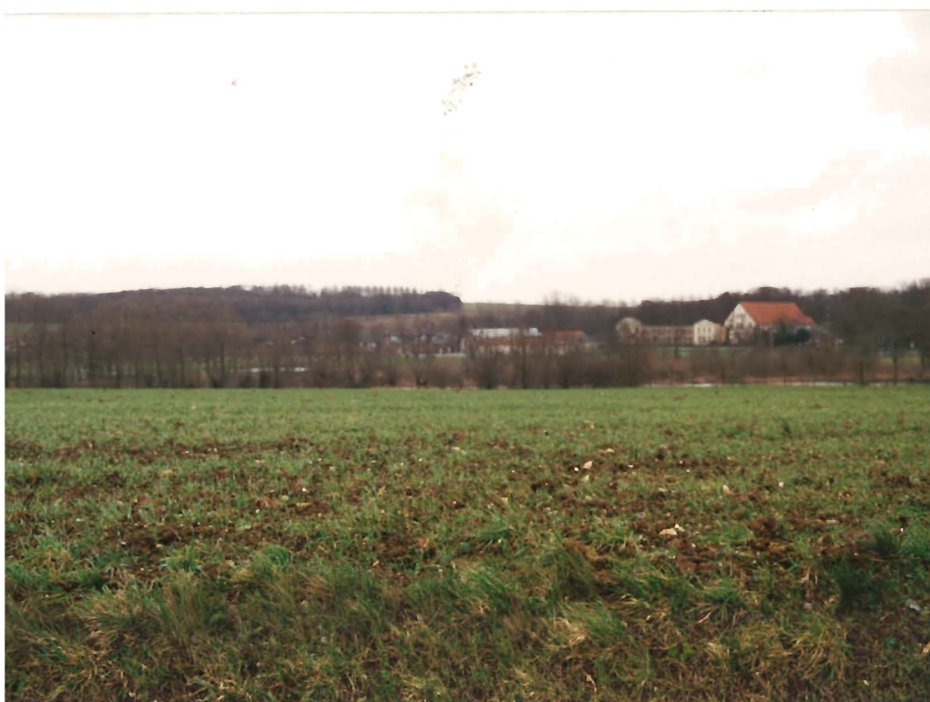
Vers l'abbaye de Vaucelles