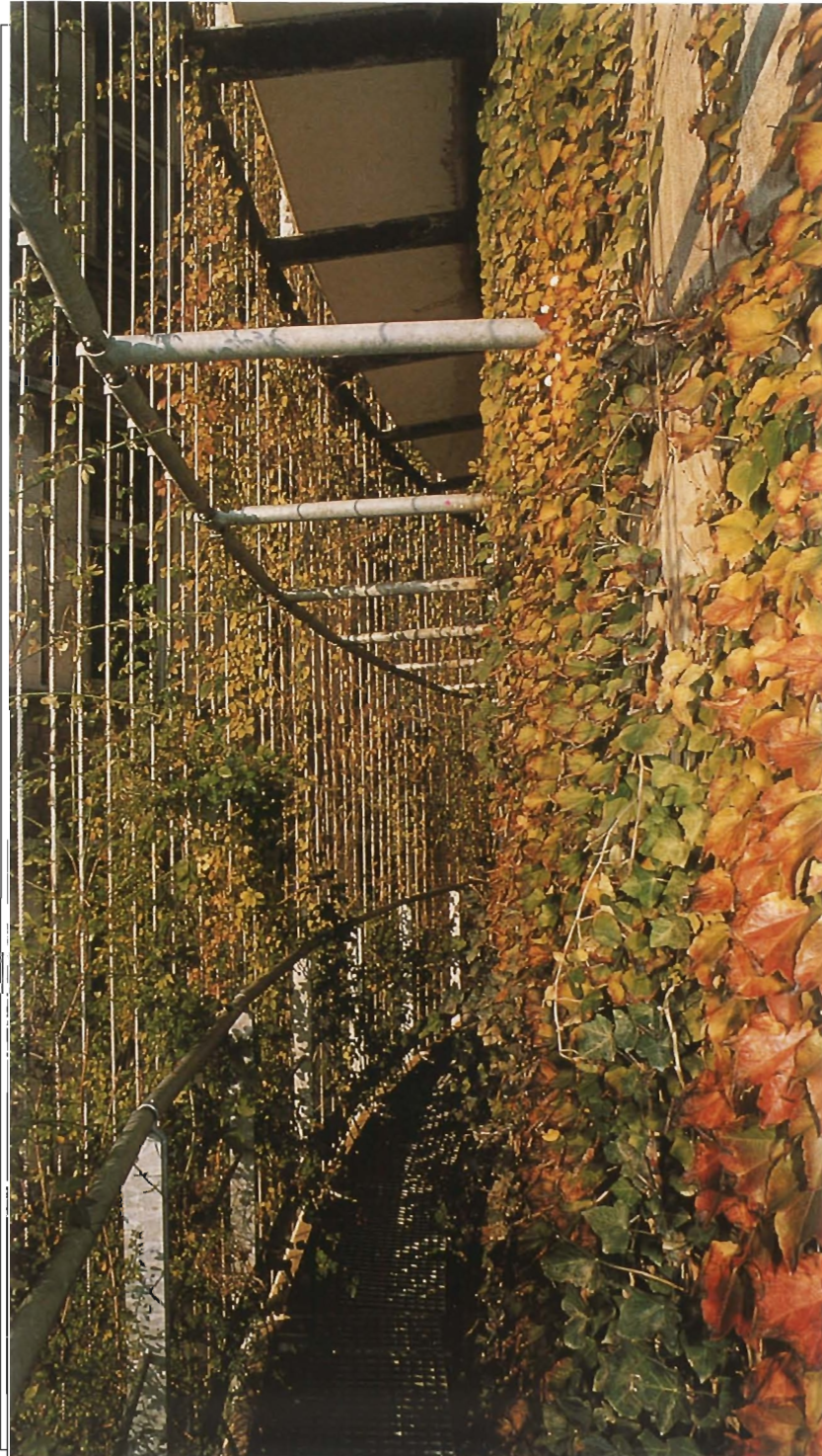
Escalier de l'hôpital Huriez à Lille