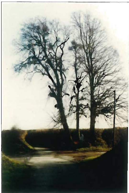
Chapelle à la croisée des chemins