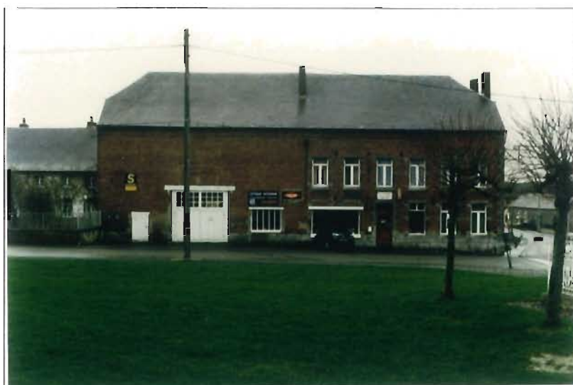
Une architecture de pierre, de brique et d'ardoise.

Une attention toute particulière sera apportée sur les structures végétales et sur l'eau.. Les haies sont des éléments de structure du paysage à l'équilibre précaire. Des indications pourront être données sur les secteurs à conserver et à replanter en tenant compte des paramètres économiques, d'exploitabilité et de leur importance paysagère. Il conviendra de se rapprocher de l'Association pour l'Aménagement et le Développement de l'Avesnois (futur Parc Naturel).