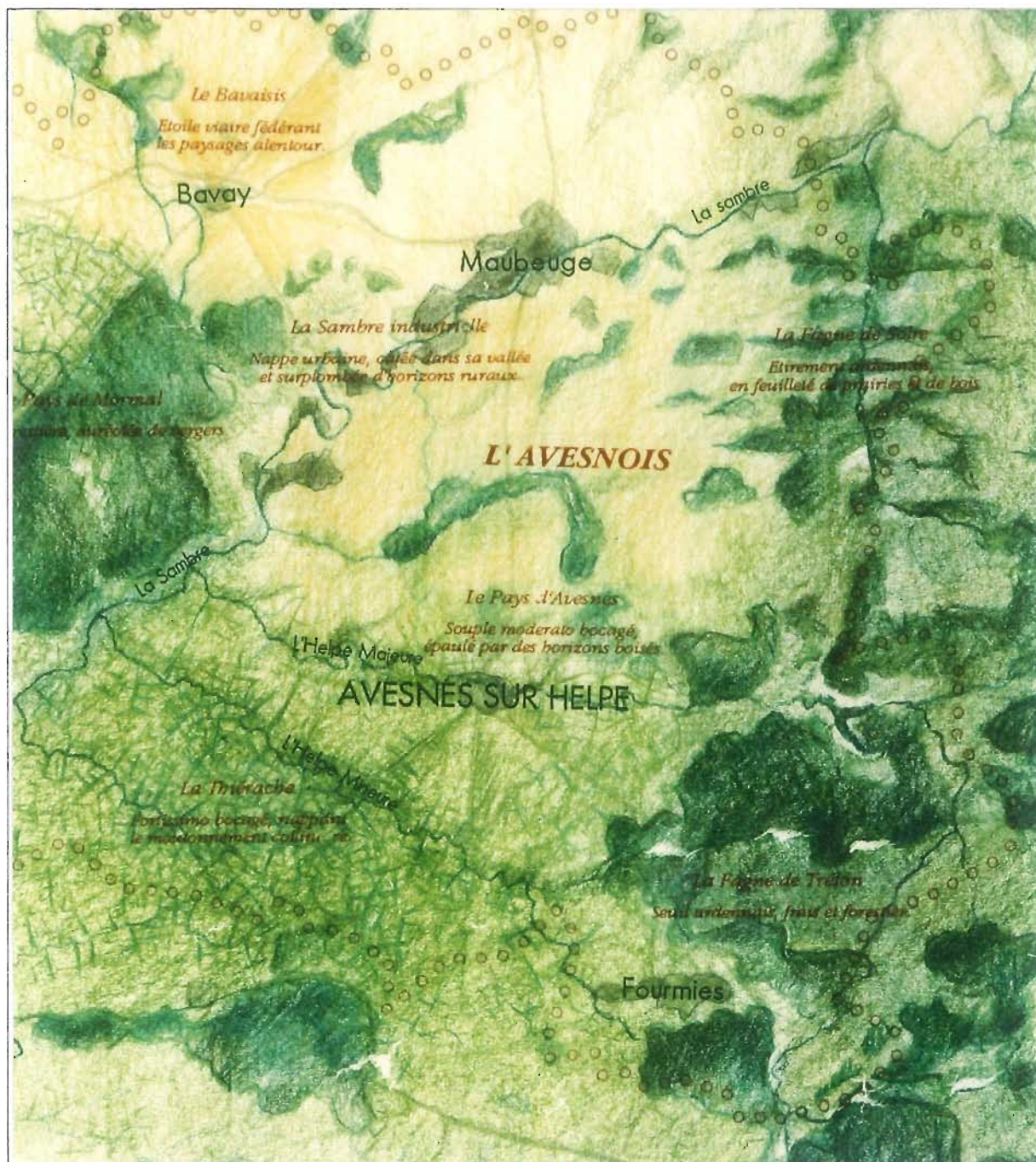
Extrait de la carte des paysages Conseil Général - CAUE