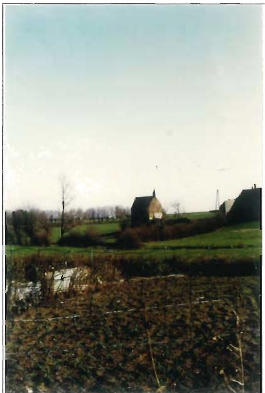
La Chapelle Saint Julien

Le cahier de recommandations (cf. Reconnaissances paysagères) ne sera ici pas oublié, pour s'attacher en particulier à la Chapelle Saint Julien (patrimoine historique de Dourlers) en mauvais état.