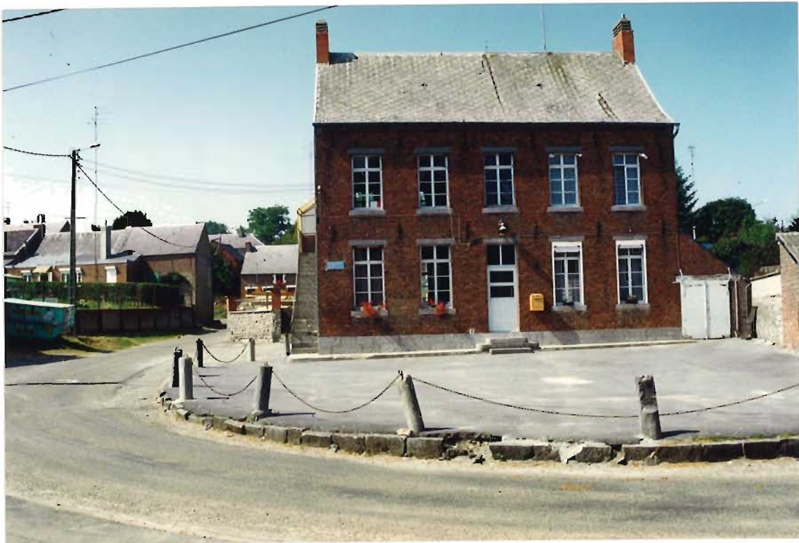
La place de l'école

Il s'attachera à résoudre les problèmes d'espace au sens large dans leur globalités et à apporter des réponses sur des points de détail comme par exemple : le mobilier spécifique à la commune ou l'emplacement de la benne à encombrants