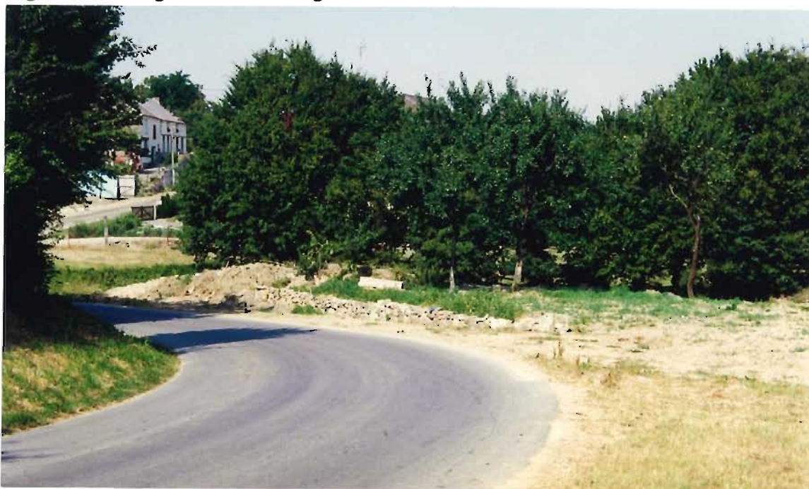
Le terrain communal à l'entrée ouest de Damousies

L'étude proposera sous la forme d' esquisses chiffrées illustrées de croquis descriptifs des réponses sur l'espace minéral, le mobilier et l'éclairage, sur le végétal : arbres tiges, haies arbustives