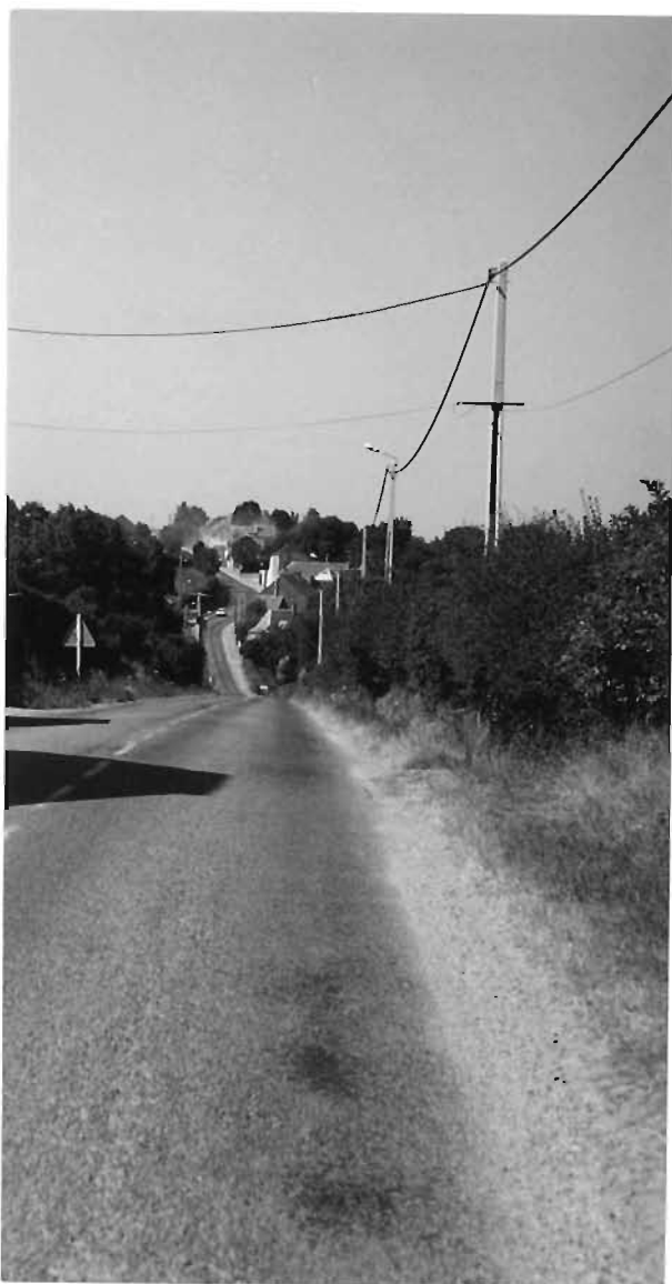
Le chemin départemental 27 dans la traversée du village

Village de 250 habitants environ, Damousies est une commune rurale, blottie sur les rebords de la vallée de la Solre à la confluence du ruisseau de Glarge, à quelques kilomètres de l'agglomération sambriène