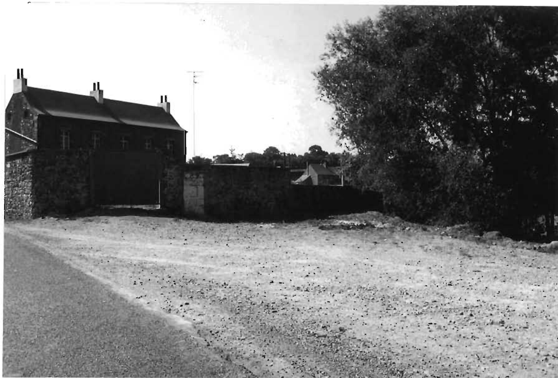
LES ABORDS DE LA MAIRE : Terrain délaissé à l'arrière du bâtiment