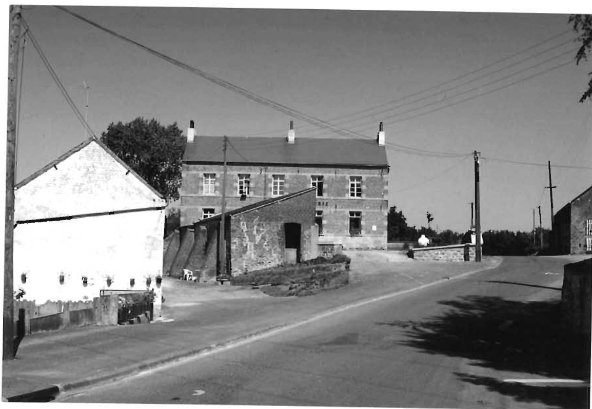
LA FACADE AVANT DE LA MAIRIE : Le bâtiment de qualité flotte dans un espace mal structuré sans cohérence avec l'église.