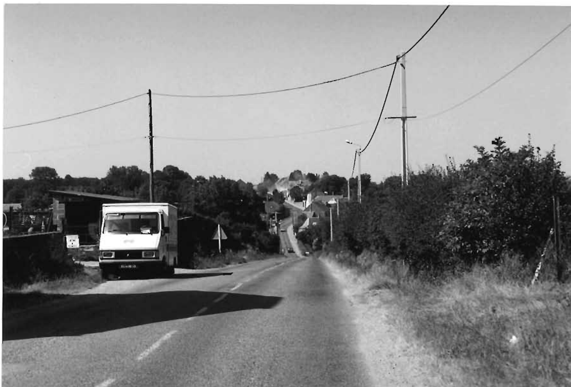
Le chemin départemental à l'entrée sud : au calvaire

L'étude devrait être l'occasion de faire une analyse fine des questions qui se posent sur ces lieux et faire sous forme d' esquisses chiffrées des propositions d'aménagements .