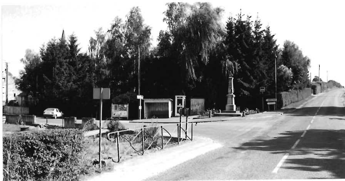
Le carrefour de la place du Monument aux morts .

Il s'agit pour l'ensemble du parcours du chemin départemental, d'établir en étroite relation avec les partenaires institutionnels (D.D.E. - C.D.E.S. -D.V.I. Conseil Général) des schémas de principes qui seront dans un deuxième temps détaillés sur les points forts sous forme d' esquisses chiffrées .