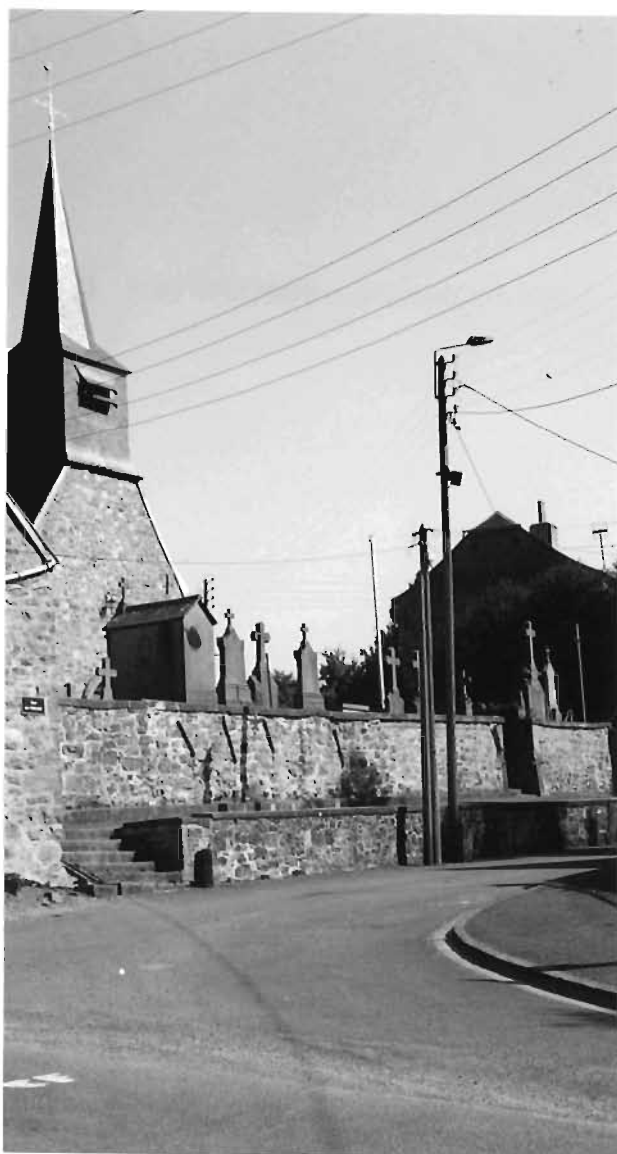
La place de l'église.

Il semble important de faire l'analyse des lieux et de proposer un-Avant Projet-Sommaire chiffrée illustrée de croquis.