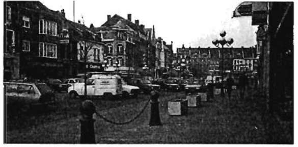
Le mail St Martin : les différentes circulations.

La rue neuve ; cette petite rue ancienne, commerçante, est réservée aux piétons. Au cours de la réalisation le propriétaire de la supérette à l'angle de la rue et de la grand-place propose d'accoler 9 cellules commerciales pour retrouver l'alignement, l'échelle et le rythme de la rue et masquer l'ancienne façade. Le terrain nécessaire est racheté au domaine public. Les nouvelles constructions en briques et bois, le mobilier urbain, (bancs, colonne Morris...) et le revêtement de sol unifient l'aspect de la rue.