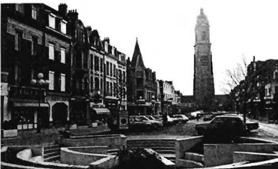
Le mail St Martin : l'amphithéâtre et le beffroi.