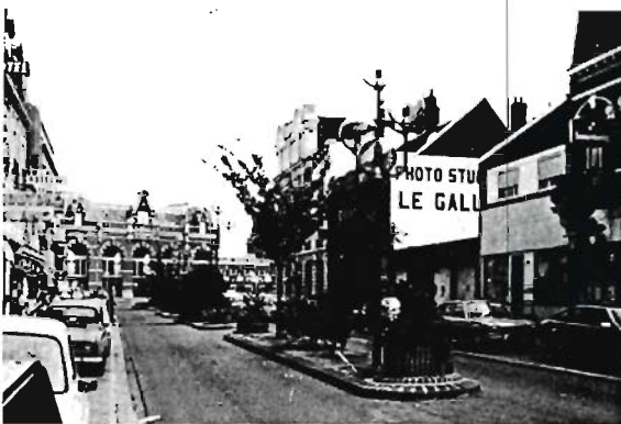
La rue reliant la gare à la grand'place.