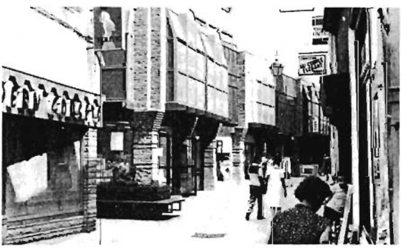
La rue neuve : rue piétonne commerçante.

Ces actions d'aménagements d'espaces publics s'inscrivent dans la logique d'une politique de réhabilitation du centre ville et des monuments menée patiemment par les élus.