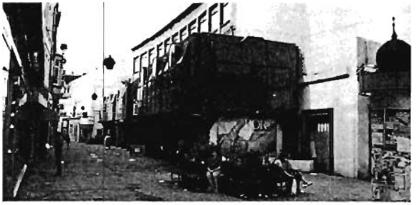
La rue neuve : l'ancienne et la nouvelle façade

Conception : Services Techniques de Cambrai.